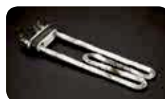
Defekte Elemente / Résistance endommagée / Resistenza danneggiata

Entfernt unangenehme Gerüche Supprime les mauvaises odeurs Rimuove i cattivi odori