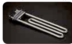
Saubere Elemente / Résistance propre / Resistenza pulita